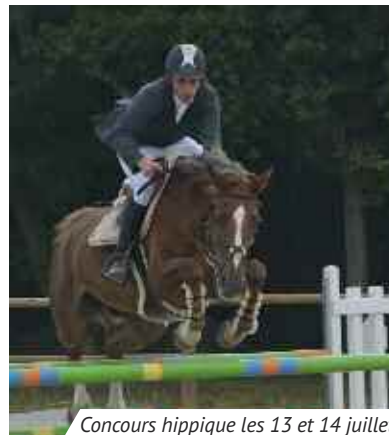
Concours hippique les 13 et 14 juillet.

Mardi 7 à 19h30 , animation "A la recherche du castor". Réservation : 02 47 50 97 52. Maison de la Loire .