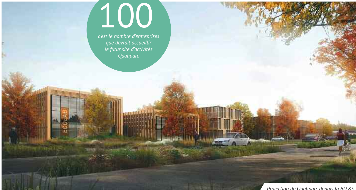
Projection de Qualiparc depuis la RD 85.

c'est le nombre d'entreprises que devrait accueillir le futur site d'activités Qualiparc