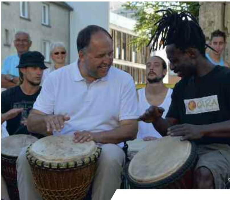
C'est aux rythmes des djembés que s'est ouverte la saison estivale lors de la Fête de la musique.

L'été approche et avec lui reviennent nos rendez-vous festifs : fête de la musique, 14 juillet et... quelques surprises comme trois nouveaux marchés nocturnes, place Courtemanche en bord de Loire, les 17 et 31 juillet et le 14 août. En journée, l'Office de tourisme et ses animations, le camping, la piscine municipale, les activités d'"Un été pour tous" ou encore le tracé viticole de la Loire à vélo donneront à Montlouis un rythme estival, que l'équipe municipale vous souhaite doux et enjoué.