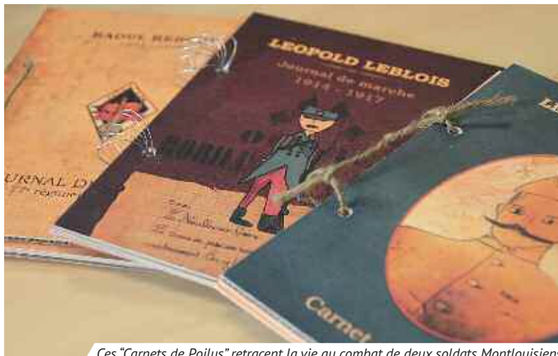
Ces "Carnets de Poilus" retracent la vie au combat de deux soldats Montlousiens.

Cet été, du 15 au 17 juillet se tient un atelier créatif en famille et tous les après-midis, les 10-17 ans sont accueillis pour des activités diversifiées. www.apam-mlc.fr