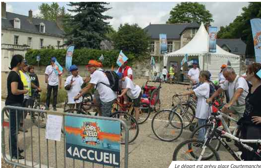
Le départ est prévu place Courtemanche.