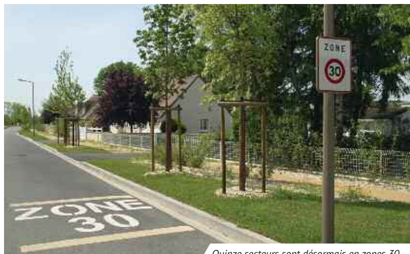
Quinze secteurs sont désormais en zones 30.

Une réflexion a été menée sur les zones 30 à Montlouis et un premier constat a permis de faire apparaître des zones de circulation hétérogènes. La direction des services technique de la Ville a donc créé, redéfini et requalifié des périmètres en zone 30. Quinze secteurs regroupant plusieurs rues ou un quartier entier sont répartis sur l'ensemble de la commune : "Centre ville", "Les Fosses Bouteilles", "Côteaux nord et sud", "Husseau"... Pour rappel, une zone 30 délimite un périmètre urbain dans lequel la vitesse du trafic est modérée pour favoriser la cohabitation de tous les usagers de la voirie ; la vitesse maximale autorisée est de 30 km/h pour tous les véhicules. Ces zones de circulation homogènes sont matérialisées par une signalisation verticale réglementaire, en entrée et sortie de zone. L'entrée dans les zones a été renforcée par une signalisation au sol, ou encore par des chicanes ou des ralentisseurs.