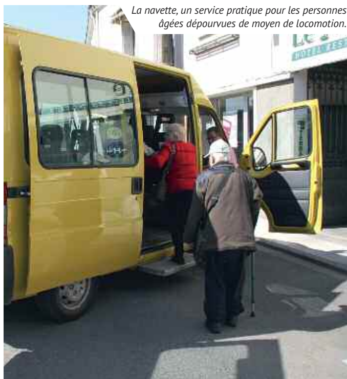
La navette, un service pratique pour les personnes âgées dépourvues de moyen de locomotion.

Ce contrôle est également obligatoire pour toute vente immobilière sur la commune. Direction Eau et Assainissement. Tél. : 02 47 50 93 05 eau@ville-montlouis-loire.fr