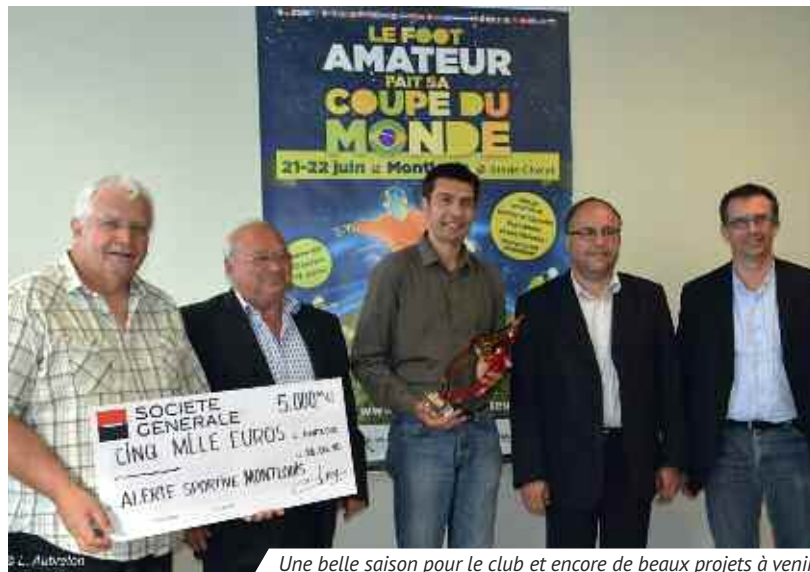
Une belle saison pour le club et encore de beaux projets à venir.