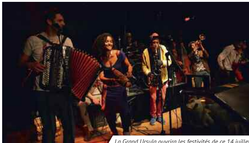
La Grand Ursula ouvrira les festivités de ce 14 juillet.

Ambiance salsa cette année encore à Montlouis, stade Eugène-Cholet, pour fêter le 14 juillet avec deux formations : une de cumbia festive, La Gran Ursula , à 19h30 et l'autre de musique latine métissée, entre tradition sud-américaine (tango, salsa, merengue) et musiques dites actuelles (hip-hop, reggae, rock), Duende , à 21h30.