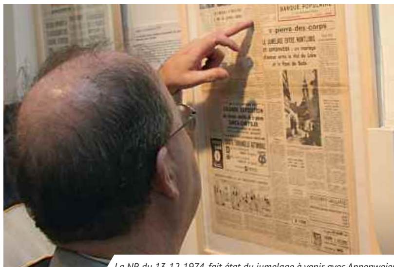
La NR du 13-12-1974, fait état du jumelage à venir avec Appenweier.

Dans le cadre du 40 e anniversaire du jumelage entre Montlouis-sur-Loire et Appenweier, les festivités se dérouleront du 21 au 24 août en Allemagne et dans un second temps durant l'été 2016 en Touraine.