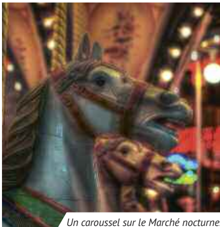
Un carroussel sur le Marché nocturne.

Samedi 25 de 15h à 22h , rencontre et stage pratique avec le photographe Patrick Brault. Réservation : 02 47 50 97 52.