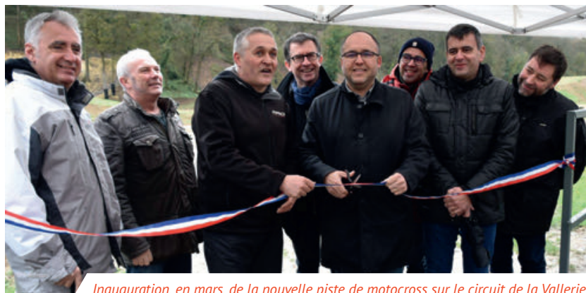
Inauguration, en mars, de la nouvelle piste de motocross sur le circuit de la Vallerie.

Pour répondre aux nouvelles normes de la fédération française de motocyclisme, l'amicale motocycliste montlouisienne a dû procéder à la réfection du circuit de la Vallerie.