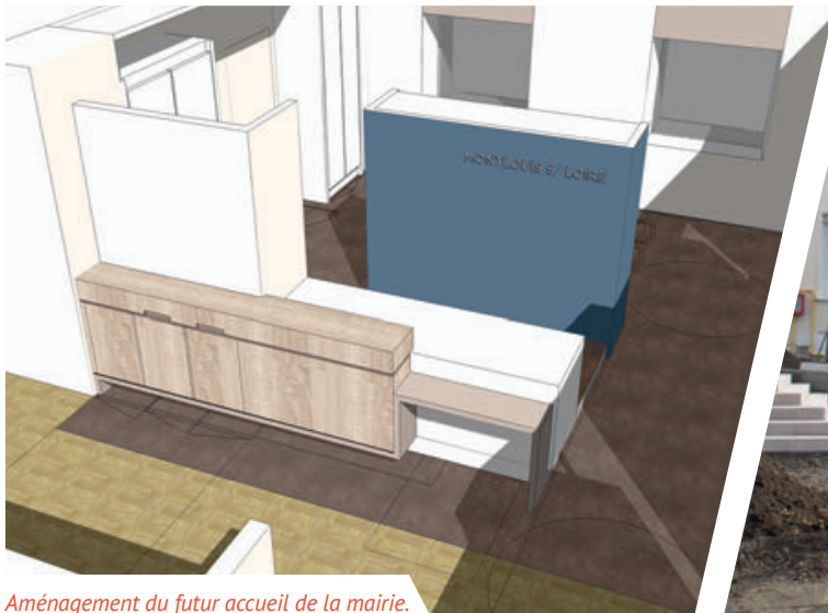
Aménagement du futur accueil de la mairie.