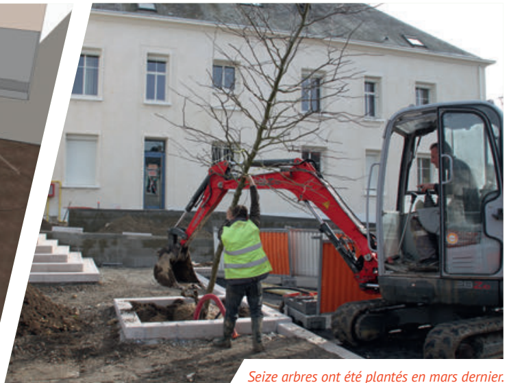
Seize arbres ont été plantés en mars dernier.

Débutée mi-mai 2016 la rénovation du centre-ville touche bientôt à sa fin. Après douze mois de travaux, les Montlouisiens vont désormais pouvoir profiter d'un espace attractif.