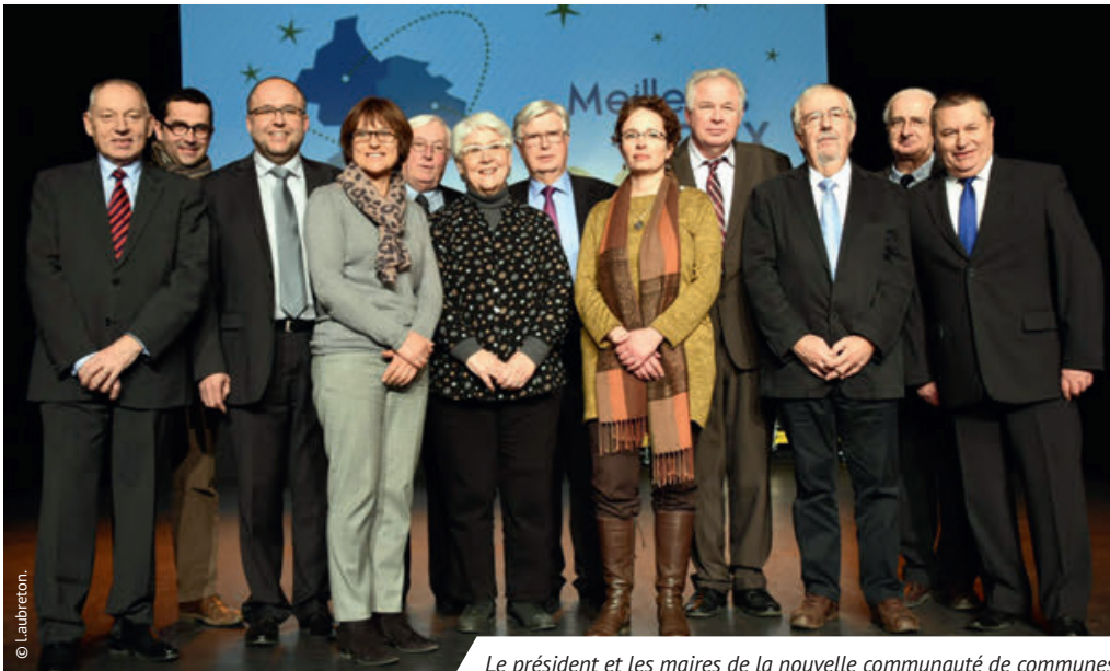
Le président et les maires de la nouvelle communauté de communes.