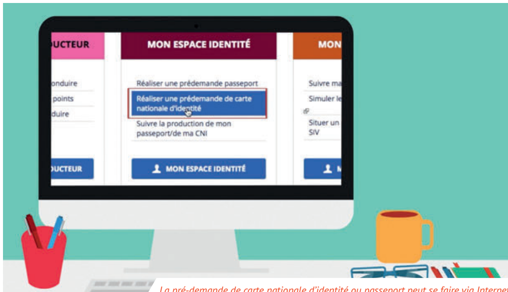
La pré-demande de carte nationale d'identité ou passeport peut se faire via Internet.