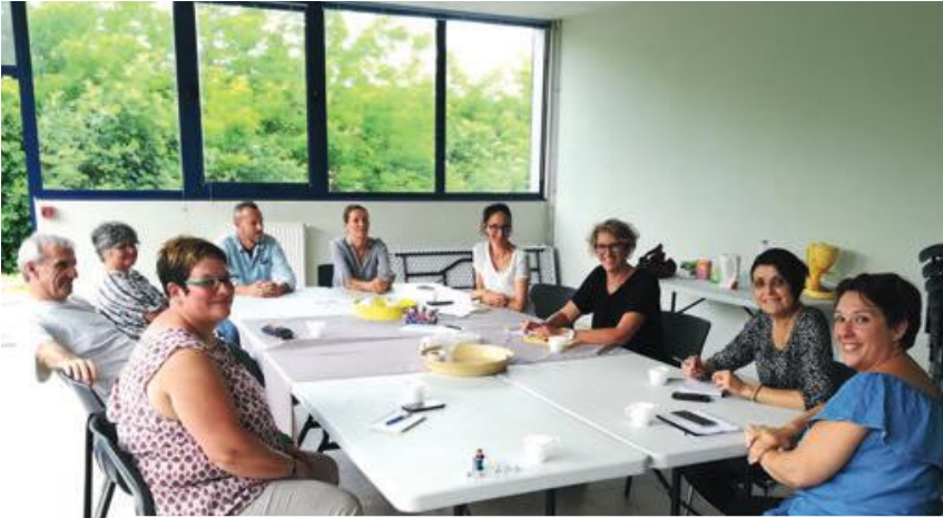
Parents et professionnels ont croisé leur expérience ce qui a donné lieu à de riches échanges.