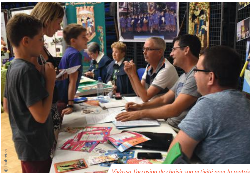
Viv'asso, l'occasion de choisir son activité pour la rentrée.