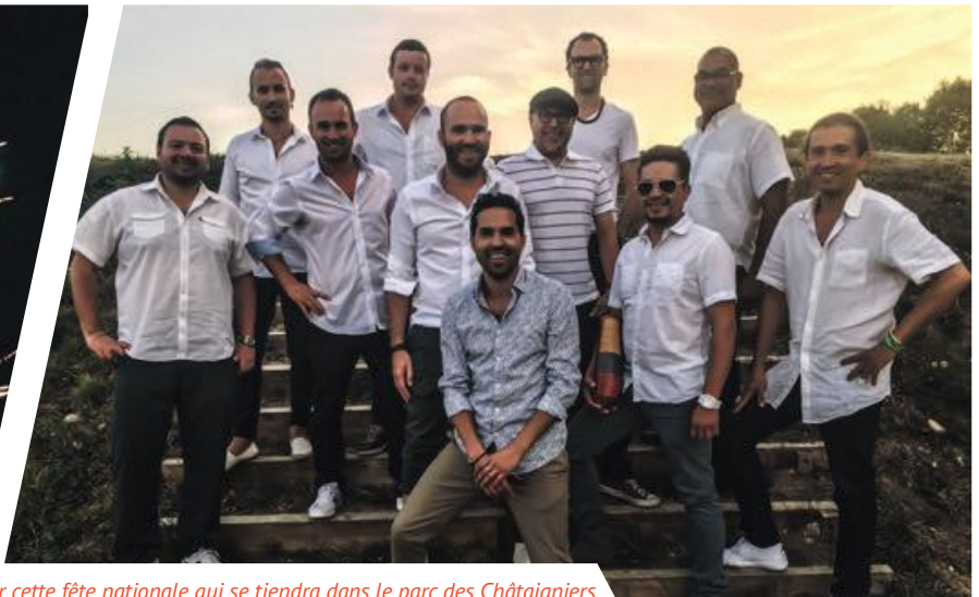
Ambiance festive et colorée pour cette fête nationale qui se tiendra dans le parc des Châtaigniers.