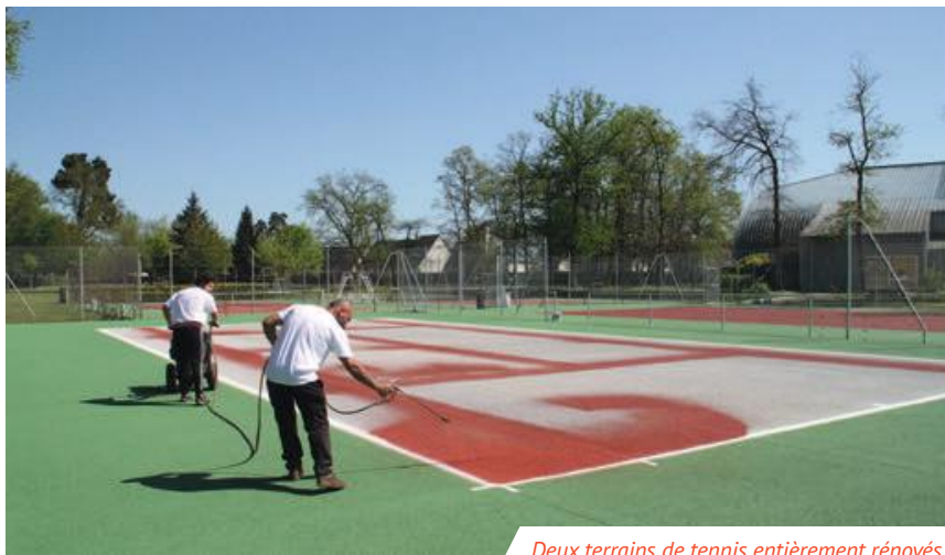
Deux terrains de tennis entièrement rénovés.