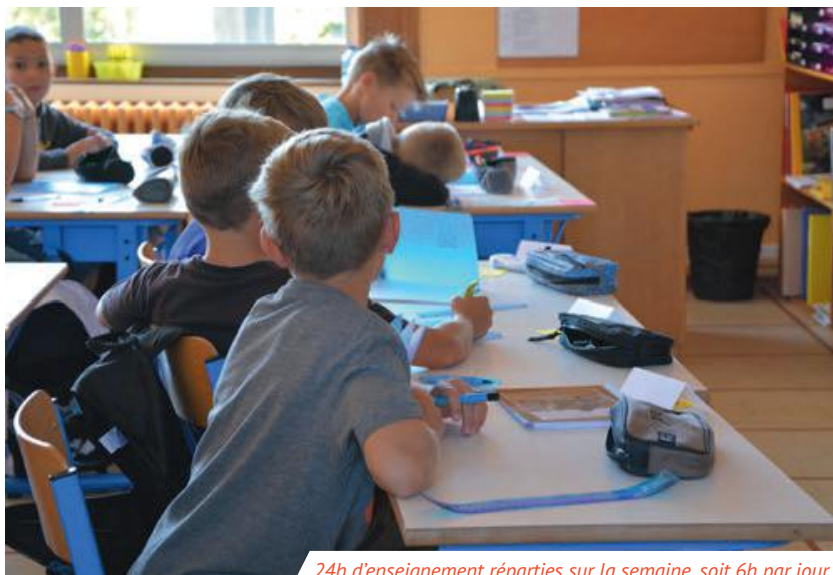
24h d'enseignement réparties sur la semaine, soit 6h par jour.

S uite à la large concertation avec les familles et la communauté éducative, le directeur académique a acté le retour à la semaine de 4 jours à partir de septembre 2018.