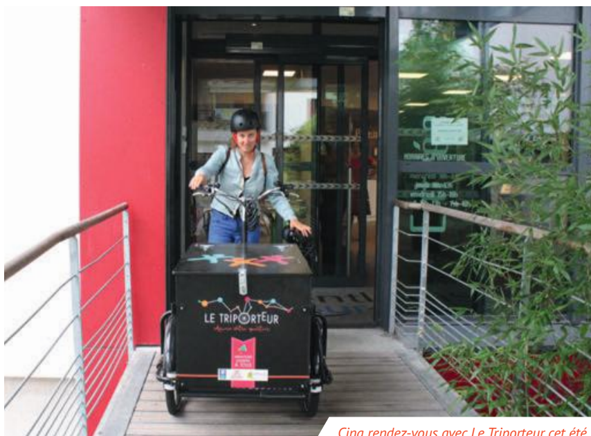
Cinq rendez-vous avec Le Triporteur cet été.