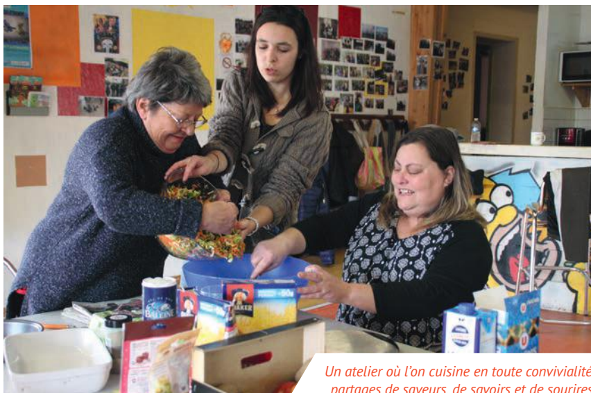
Un atelier où l'on cuisine en toute convivialité : partages de saveurs, de savoirs et de sourires.

Né fin 2017, le collectif "Les p'tites popotes" (constitué uniquement de femmes pour le moment), se retrouve chaque mois au centre socio-culturel La Passerelle. Son objectif, favoriser le lien social et la mixité autour d'un projet collectif, grâce à un atelier cuisine. L'atelier est encadré par des bénévoles ; il est l'occasion d'apprendre à cuisiner à faible coût (en cuisinant des ingrédients de saison déclassés, donnés gracieusement par un maraîcher local) ; permet aux participantes de (re)prendre confiance en elles par le biais de l'activité culinaire ; et vise à informer sur l'équilibre alimentaire grâce notamment aux conseils d'une diététicienne.