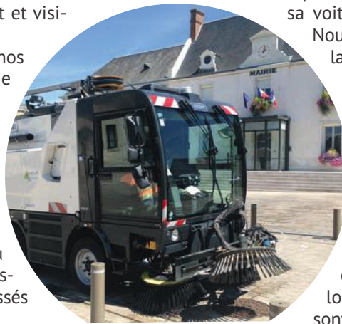
Acquise au cours de l'été dernier, la balayeuse a parcouru jusqu'à fin décembre 2018, plus de 1500 km et collecté 140 tonnes de déchets.

Alors, comme le poète, soyons convaincus du pouvoir des fleurs !