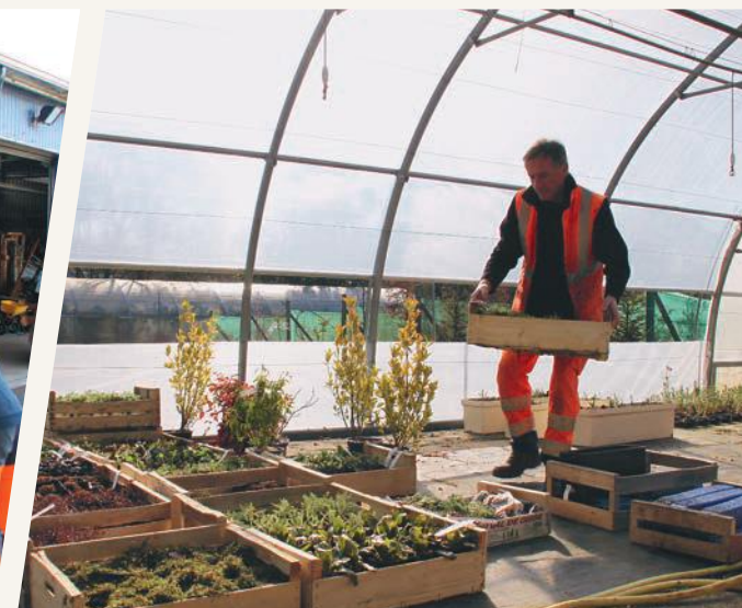
Les végétaux sont stockés dans les tunnels en attendant d'être plantés.