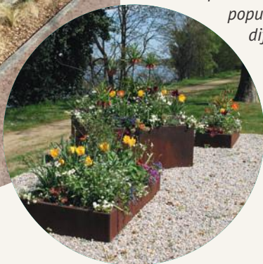
Créations du service Parcs et jardins.