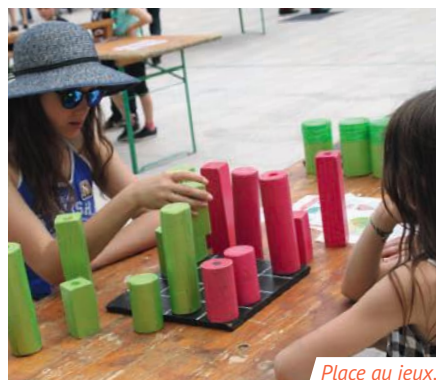
Place aux jeux.

Dimanche 9, de 10h à 2h du matin , Place aux jeux. Place François-Mitterrand.