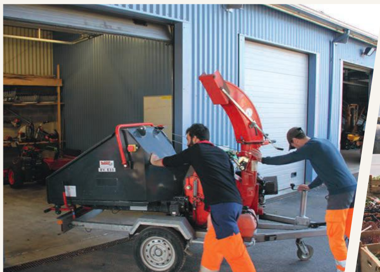
Tailler, tondre, fleurir, arroser, nettoyer les rues, entretenir les chemins... sont autant de missions confiées aux 25 agents du services Parcs et jardins.