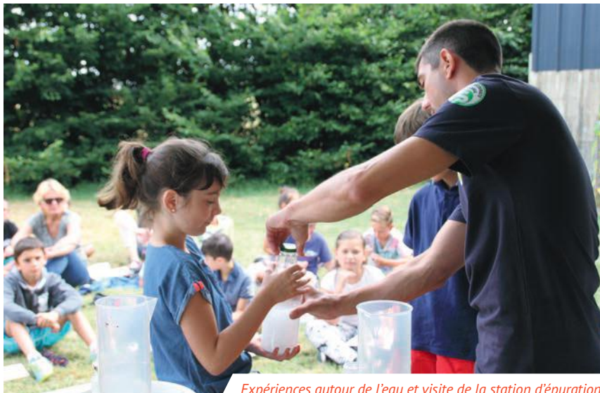
Expériences autour de l'eau et visite de la station d'épuration.

La Maison de la Loire organise pour la 3 e année scolaire consécutive, les semaines de l'eau en partenariat avec le service de l'eau et la médiathèque.