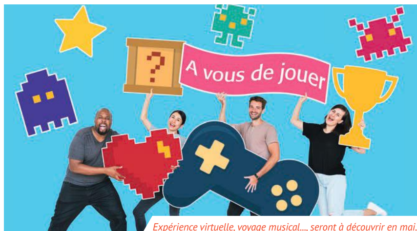
Expérience virtuelle, voyage musical..., seront à découvrir en mai.

Les jeux-vidéo sont à l'honneur à la médiathèque, l'occasion de découvrir, en mai, ce loisir qui compte toujours plus d'adeptes.